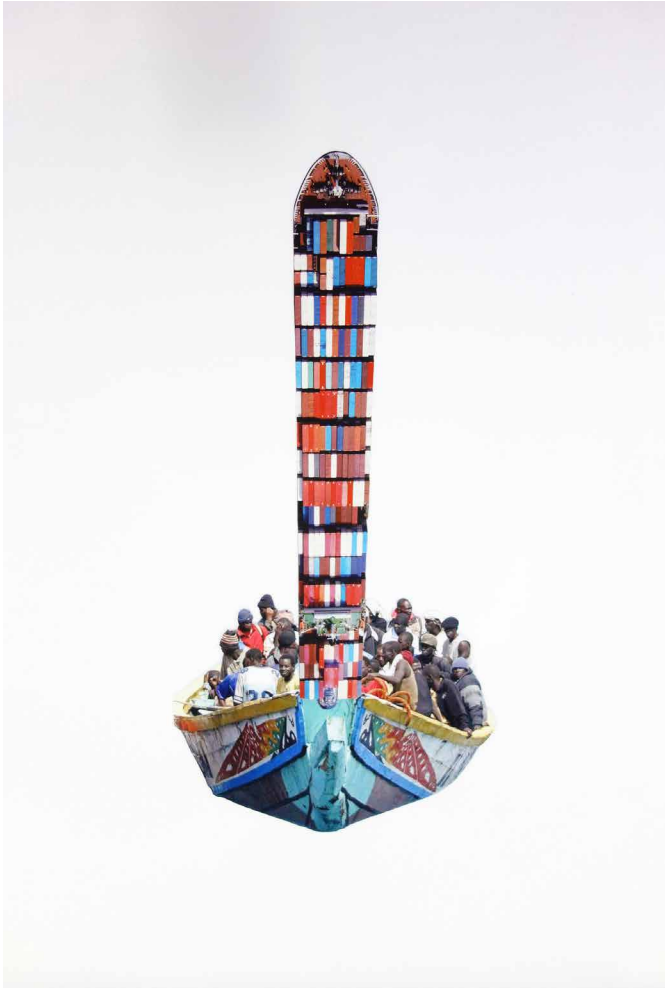
1 Anna Wańtuch MilkyWay , 2024 Videostill